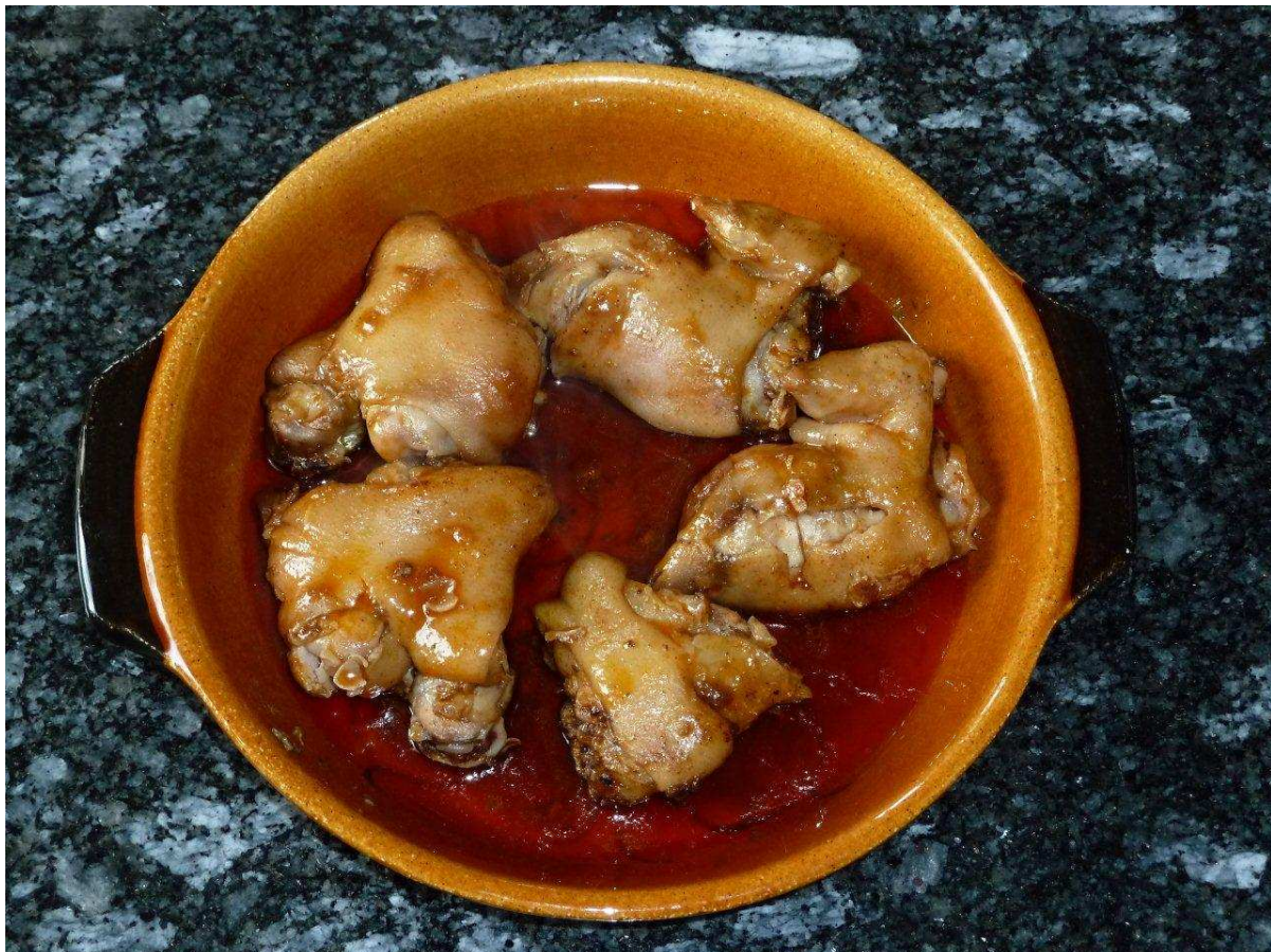
SUGERENCIA DE PRESENTACIÓN