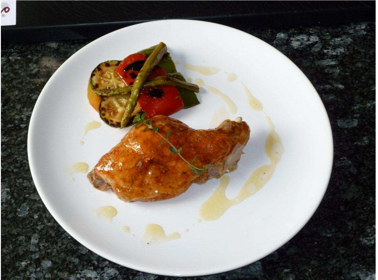
SUGERENCIA DE PRESENTACIÓN