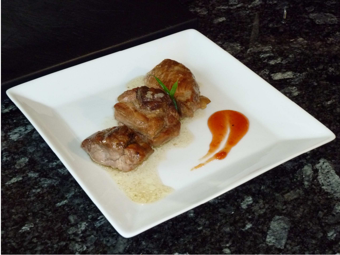
SUGERENCIA DE PRESENTACIÓN