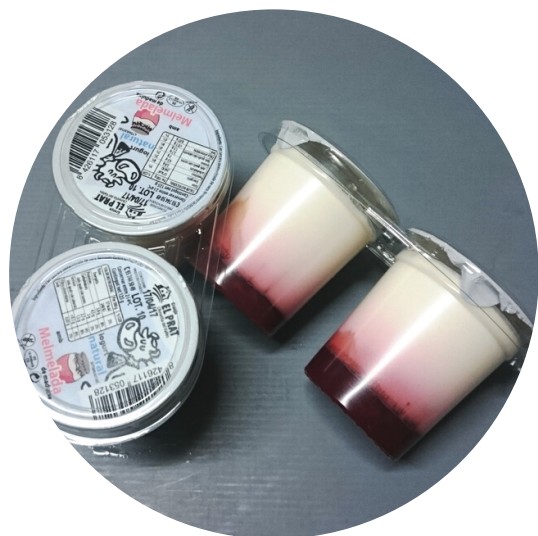
MELMELADA DE MADUIXA

En packs de: 2 o 4 unitats de 125gr. cada un.