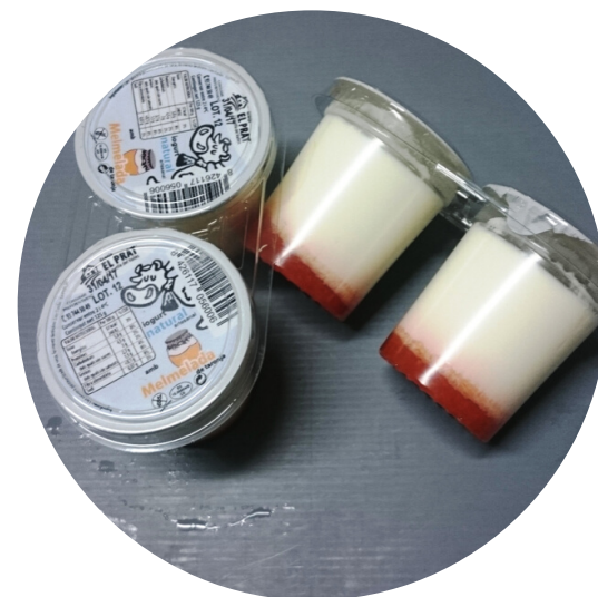
MELMELADA DE TARONJA