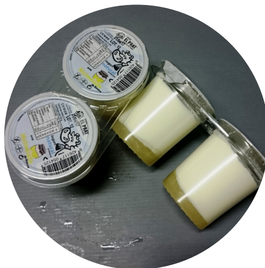
MELMELADA DE MANGO