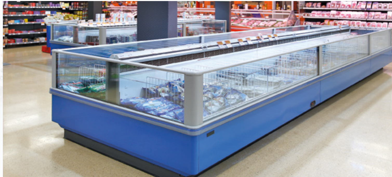
Supermercado Masymas. Llanera (Asturias)

“ En un mundo donde los mercados son cada vez más ágiles y globales, ninguna empresa puede quedarse atrás. Nosotros hemos confiado en las empresas de Grupo Migan para renovar nuestras cámaras frigoríficas, porque conocemos su preocupación por ofrecer instalaciones eficientes a sus clientes, que les faciliten el trabajo diario y les ayuden a mejorar su competitividad.