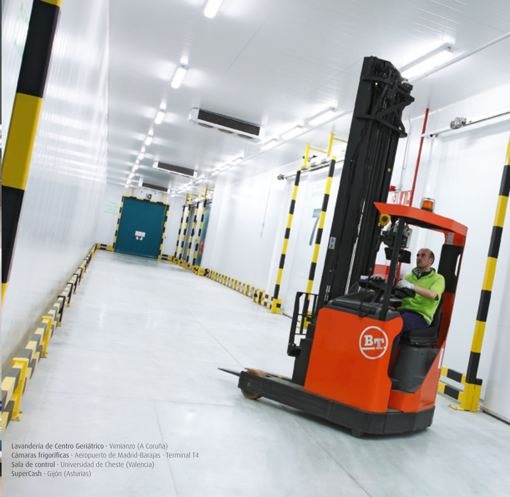
Lavandería de Centro Geriátrico · Vimianzo (A Coruña) Cámaras frigoríficas · Aeropuerto de Madrid-Barajas · Terminal T4 Sala de control · Universidad de Cheste (Valencia) SuperCash · Gijón (Asturias)