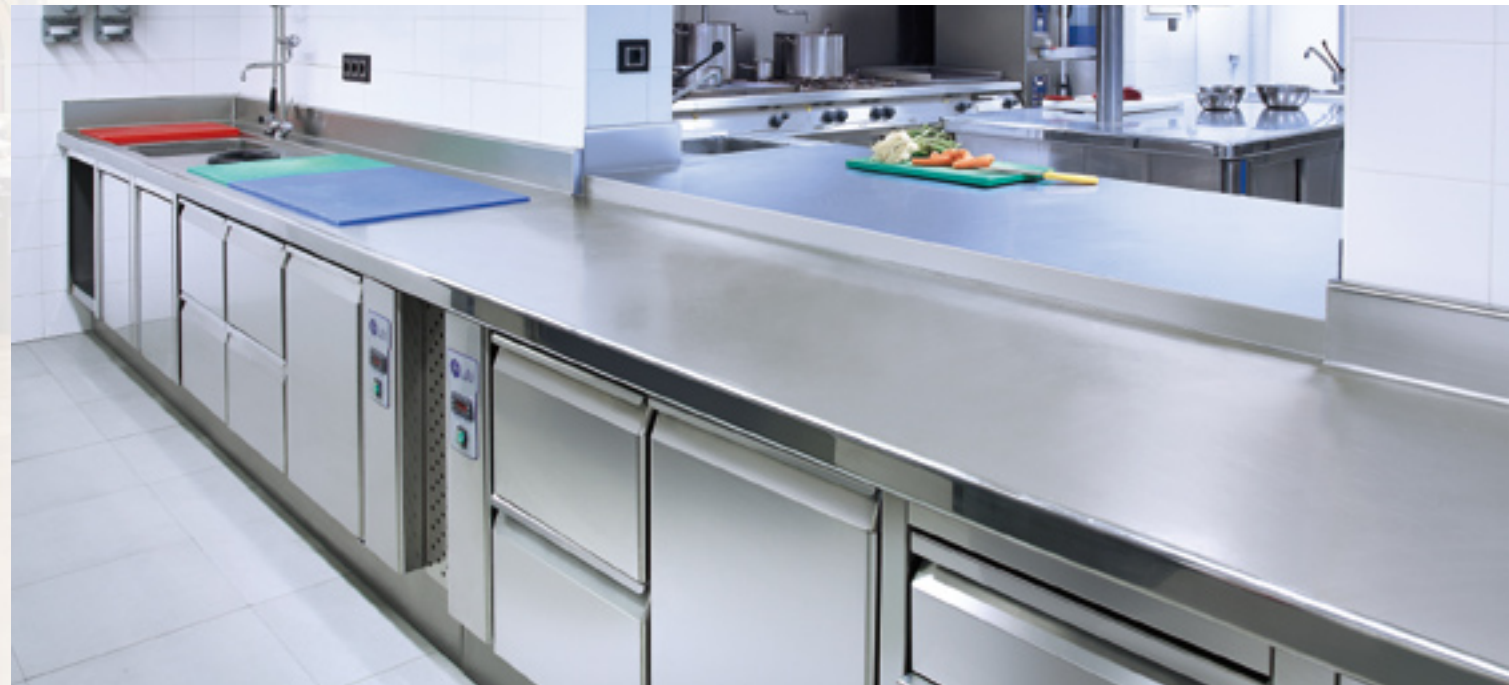
Cocinas Restaurante Tempo. Lugo.

En Tempo se agrupan diferentes ambientes que acogen a nuestros clientes a lo largo de toda la jornada: desde el desayuno en la cafetería, las cervezas o el café de la tarde en la terraza, una cena exquisita en nuestro restaurante... hasta las primeras copas de la noche en el íntimo lounge-bar. Para equipar las cocinas y las barras necesitábamos el asesoramiento de un buen equipo de profesionales. Optar por Migan fue una elección acertada.