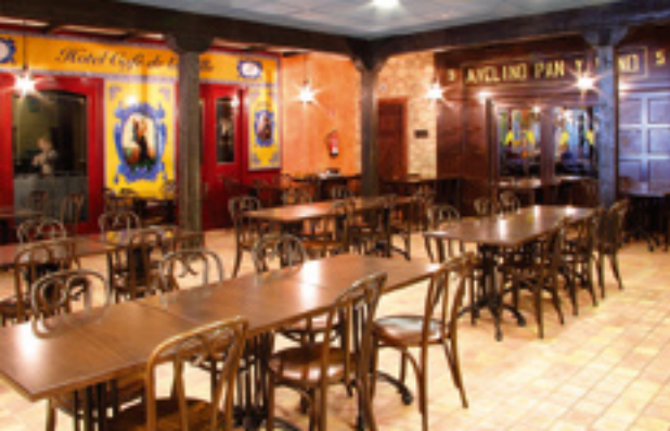
Restaurante La Pausa Aeropuerto de Madrid Barajas