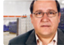
José Francisco Pacios Mariscos Pacios SL A Coruña

“ En un mundo donde los mercados son cada vez más ágiles y globales, ninguna empresa puede quedarse atrás. Nosotros hemos confiado en las empresas de Grupo Migan para renovar nuestras cámaras frigoríficas, porque conocemos su preocupación por ofrecer instalaciones eficientes a sus clientes, que les faciliten el trabajo diario y les ayuden a mejorar su competitividad.