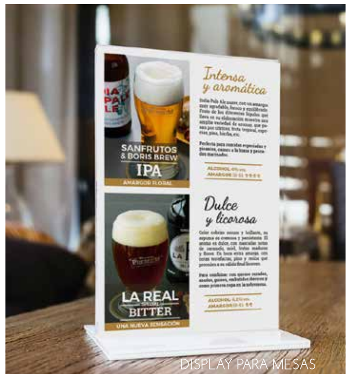
DISPLAY PARA MESAS