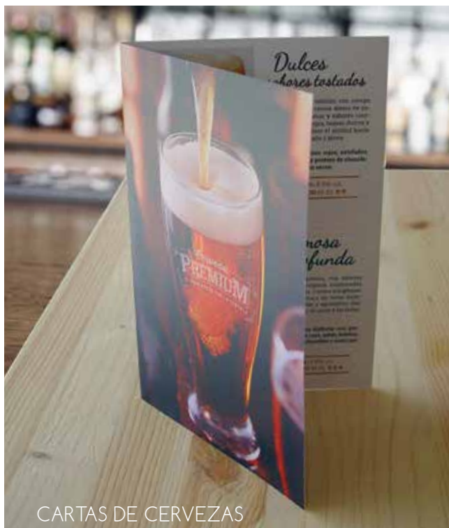
CARTAS DE CERVEZAS