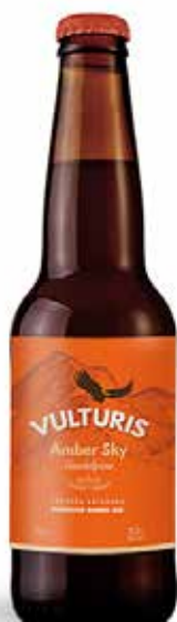
VULTURIS AMBER SKY