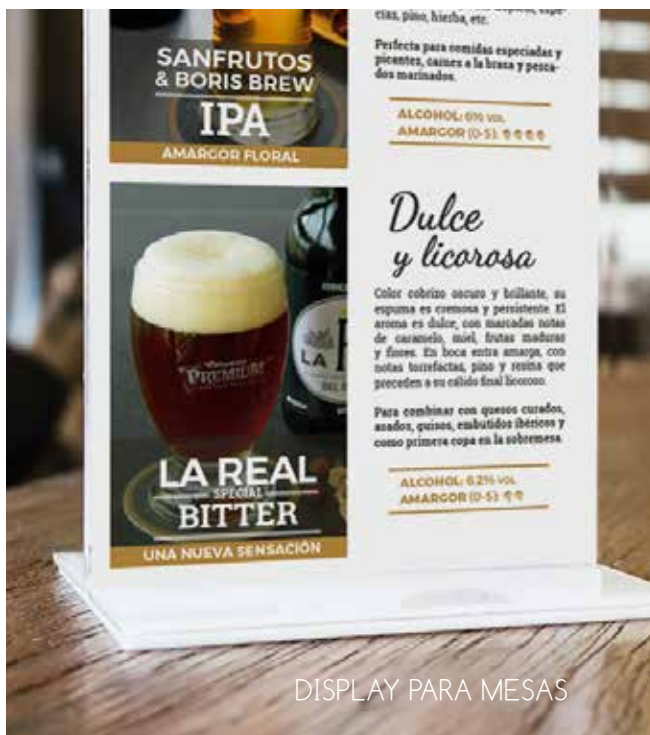
DISPLAY PARA MESAS

Además de la calidad, la estabilidad, la afinación de la receta y aspectos más técnicos de producción, buscamos las cervezas que más gustan y mejor rotan en tu establecimiento.