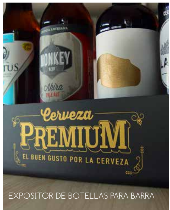
EXPOSITOR DE BOTELLAS PARA BARRA