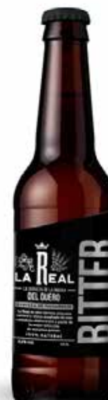
LA REAL SPECIAL BITTER

Nuestra selección de cervezas, dividida en dos lotes o configuraciones, cubren la variedad de estilos para completar una oferta variada de cervezas. Desde la primera cerveza rubia suave hasta la cerveza más compleja.