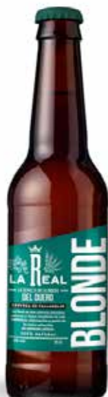
LA REAL BLONDE