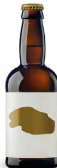
DOLINA BELGIAN DUBBEL