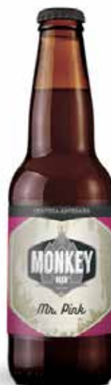
MR. PINK IPA