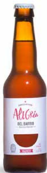
ALEGRÍA PALE ALE