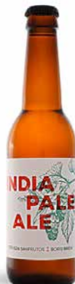
SANFRUTOS & BORIS BREW IPA