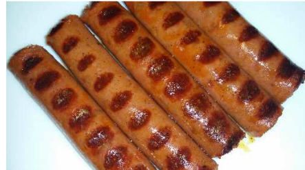
CHISTORRA PARRILLERA REF.270