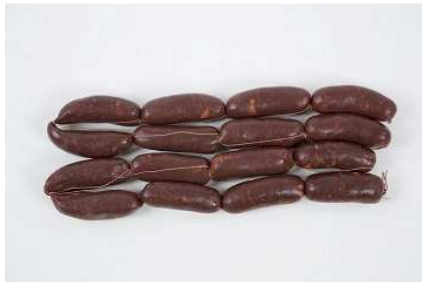
MORCILLA CEBOLLA REF. 033