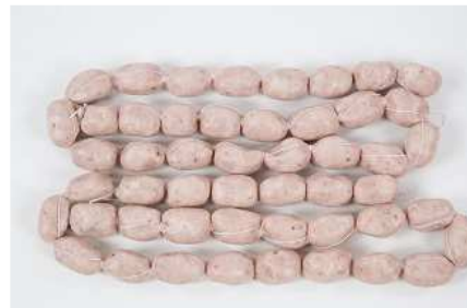
BLANQUITO REF. 207