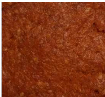
SOBRASADA REF. 277