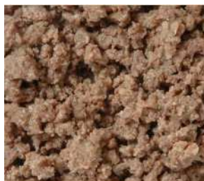
CARNE GUISADA DE VACUNO REF. 101