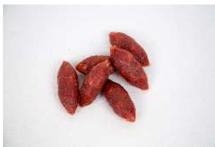
BOLITA DE CHORIZO REF. 253