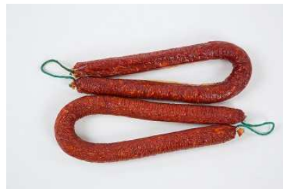
CHORIZO SARTA DULCE Y PICANTE REF. 035 Y 036