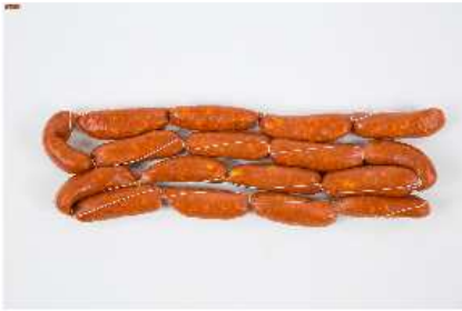
CHORIZO CASERO REF. 030