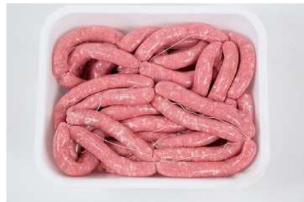
SALCHICHA DE AVE REF. 191