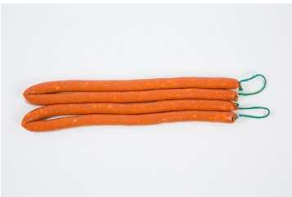
CHISTORRA REF. 087