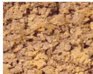
CARNE GUISADA DE VACUNO BARBACOA REF. 102