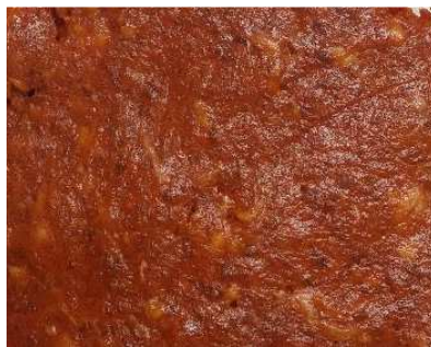
CREMA DE CHORIZO REF. 276