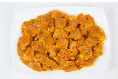
PINCHOS MORUNOS REF. 068