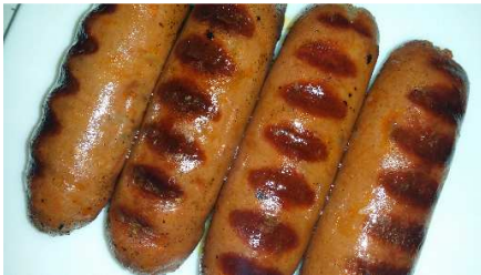
CHORIZO PARRILLERO REF. 271