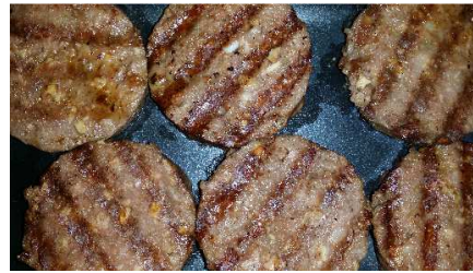
HAMBURGUESA PARRILLERA REF. 274