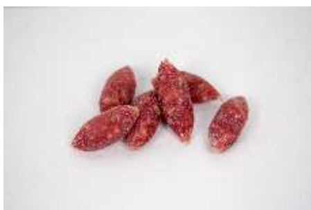
BOLITA DE FUET REF. 252