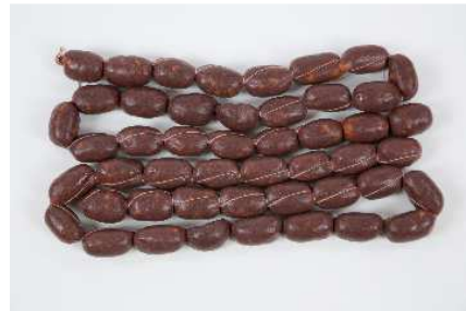
MORCILLA BOLA REF. 074