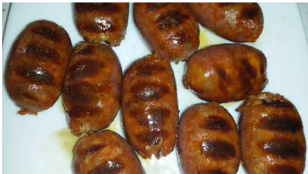
CHORIZO PINCHO REF. 273