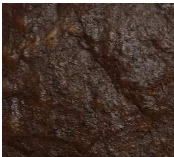
CREMA DE MORCILLA REF. 275