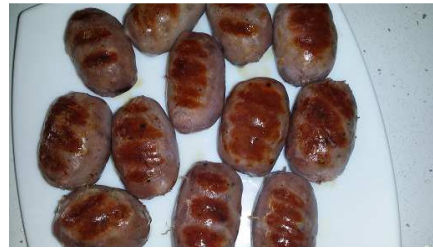
BLANQUITO PARRILLA REF. 272