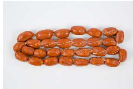
CHORIZO PINCHO REF. 048